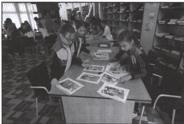
Csoportmunka a döntőn